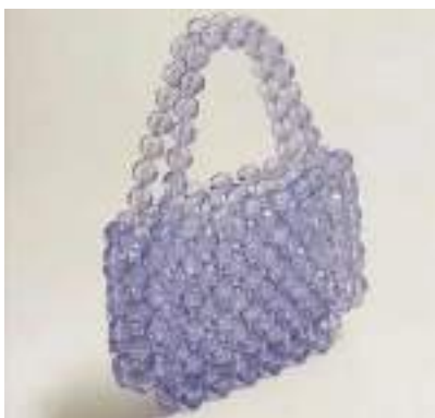
Сумочка из бисера фрейм

Вывод: Я выбрала дизайн сумочки фрейм только квадратными бусинами и в зеленом цвете и с одной ручкой.