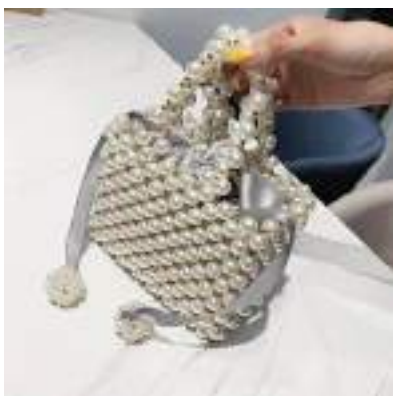
Сумочка из бисера кросс-боди