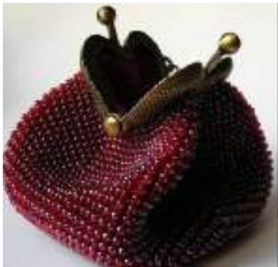
Сумочка седло из бисера