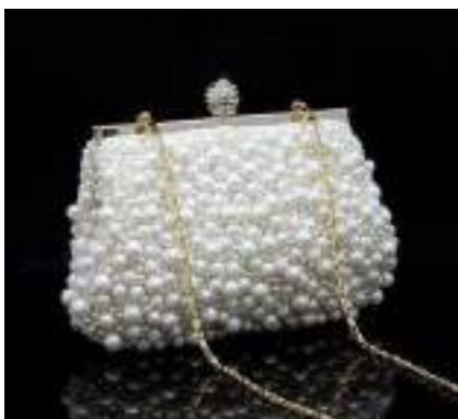
Сумочка клатч из бисера